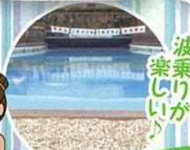
波乗りが 楽しいが 造波プール