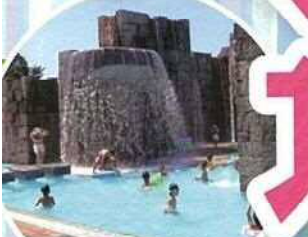
遊泳 トレーニングプール