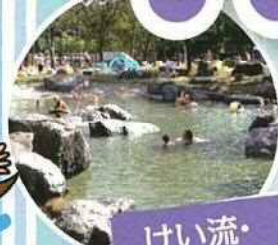
けい流・ 子供プール